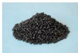
回収「柄トレー」からのリサイクル原料(ペレット)