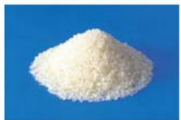
回収「白トレー」からのリサイクル原料(ペレット)